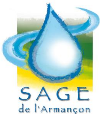
Schéma d'Aménagement et de Gestion des Eaux de l'Armançon