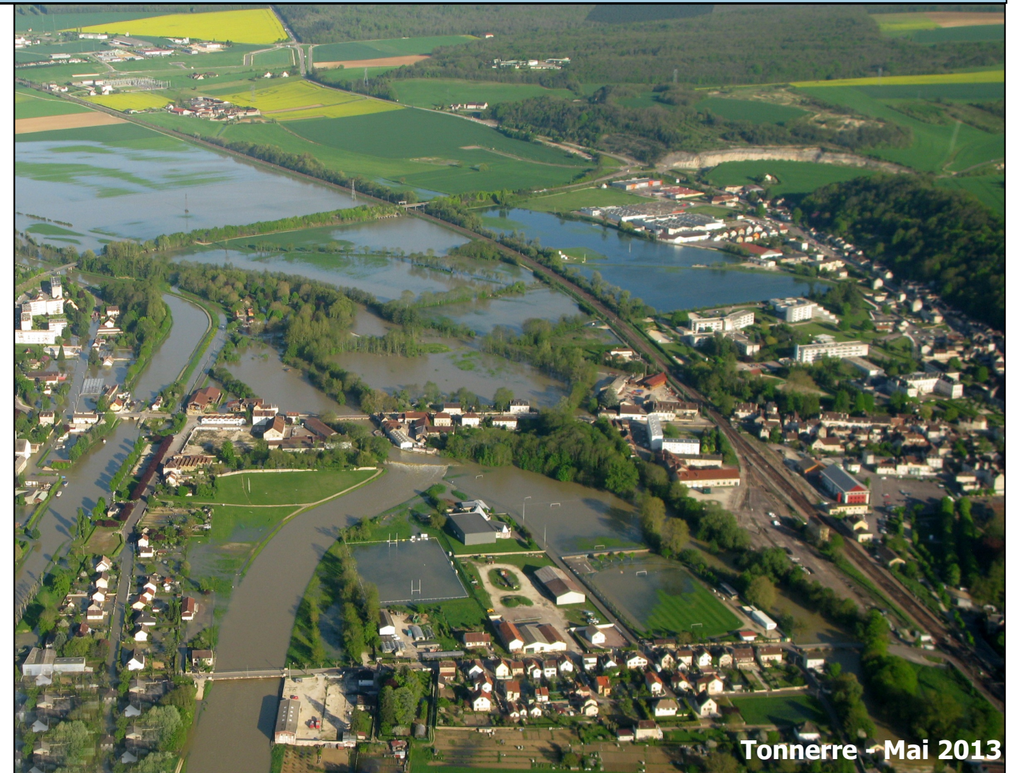
Tonnerre - Mai 2013