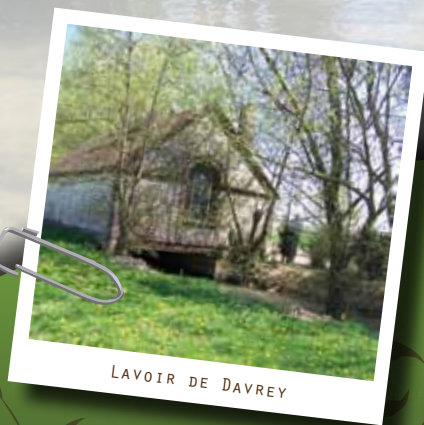
LAVOIR DE DAVREY

L'église de l'Assomption, des XII e , XVI e et XIX e siècles, présente de magnifiques vitraux du XVI e siècle, une statue de la Vierge à l'enfant et une belle croix de procession. Route d'Avreuil, une croix de rogation, la croix de Saint-Nicolas a été récemment restaurée. Autrefois, durant les trois jours précédant l'Ascension, des processions se rendaient jusqu'à cette croix afin de demander la bénédiction divine pour les récoltes et les troupeaux. Des offrandes étaient déposées sur le socle de la croix, faisant alors office de petit autel.